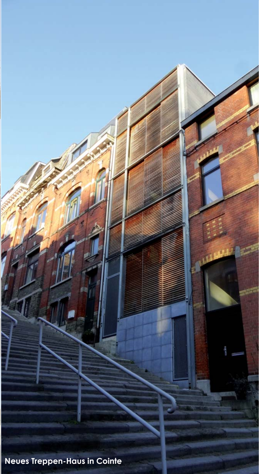
Neues Treppen-Haus in Cointe