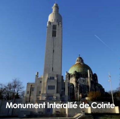
Monument Interallié de Cointe