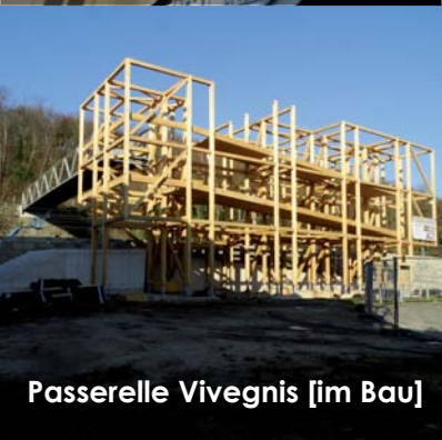
Passerelle Vivegnis [im Bau]