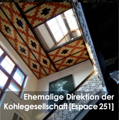
Ehemalige Direktion der Kohlegesellschaft [Espace 251]